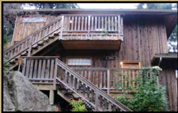
Maison Hastings. Salt Spring Island, BC, Canada

Ce produit écologique et non toxique est très apprécié des consommateurs et des entrepreneurs qui ne veulent nuire d'aucune façon à la qualité de l'environnement.