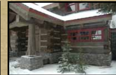
Yoho National Park Signs BC, Canada